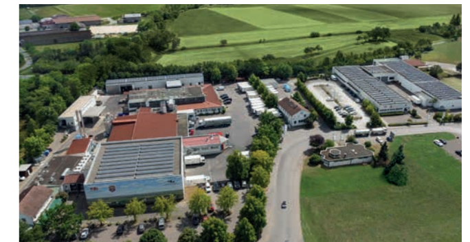
Seit 2001 in bäuerlicher Hand: Der Erzeugerschlachthof in Schwäbisch Hall.

Durch Minimierung und stofflicher Verwertung der Schlachtabfälle über Biogasanlagen anstatt Verbrennung entstehen weitere positiven Effekte auf die Klimabilanz der erzeugten Produkte.